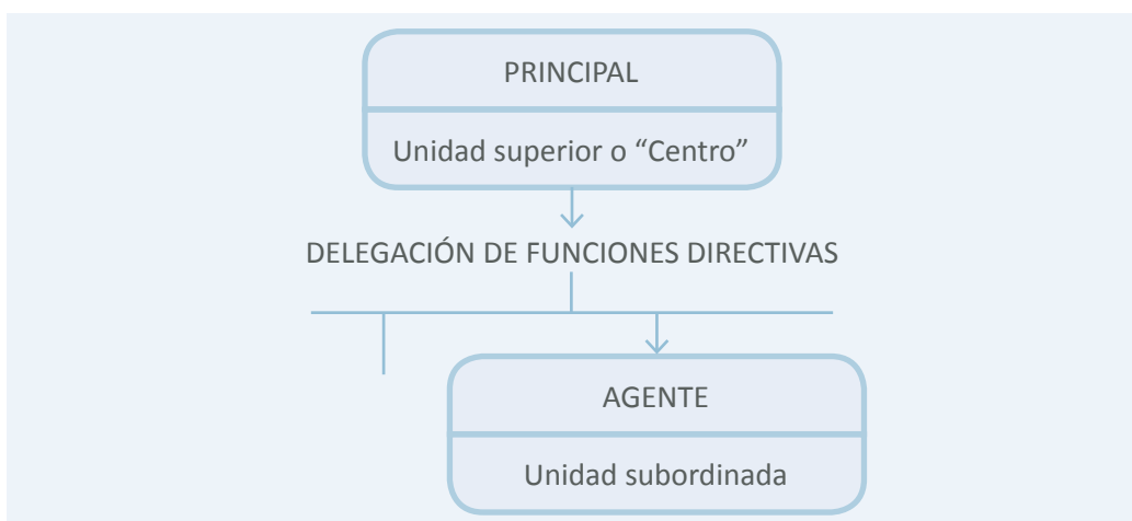
Gráfica 2. Delegación de funciones